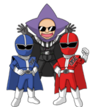
シゴセンジャーさん