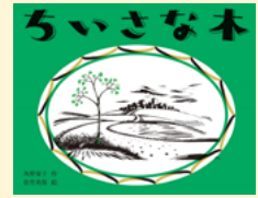
せいぎゅうきごう 請求記号 PN カ

ちいさな木が一本はえていました。ある日、家出してきたゴッチという犬がやってきて、一緒に行こうとさそいます。行き先は「じぶんのすきなところ」。旅の途中で加わった仲間とともに、それぞれの「すきなところ」にたどり着くことができるのでしょうか。『魔女の宅急便』シリーズのコンビがおくる絵本です。