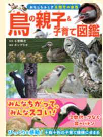
せいぎゅうきごう 請求記号 48

鳥は卵を産んだあと、どうやって子育てをするの？ えっ、子育てをしない鳥もいる！？ 環境にたくみに適応し、変化してきたさまざまな鳥の繁殖と子育ての様子を、たくさんのカラー写真と解説で分かりやすく学べます。ふしぎでユニークな鳥の世界をのぞいてみましょう。