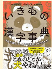
せいぎゅうきごう 請求記号 81 ア

ひともしひともし、漢字にはその成り立ちの歴史がぎゅっ！ とつまっています。例えば「狸」という字は、もともとヤマネコを表す言葉って知っていましたか？ 知れば知るほど面白い漢字の世界を、ゆるかわイラストの動物たちが、自己紹介形式でそれぞれの生態とともに解説しています。