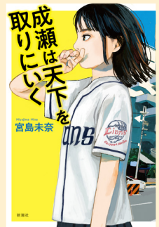
請求記号 F ミヤ

「私はこの夏を西武に捧げようと思う」。閉店を控えた西武大津店のテレビ中継に、夏休み期間中毎日映りに行く、と言い出した同級生の成瀬。滋賀県大津市を舞台に、成績優秀だけど少し変わり者の成瀬と、幼なじみの“わたし”の中学から高校卒業までの日々を、爽快感をもって描いていきます。M-1に挑戦したり、丸坊主で登校したりと、破天荒に我が道を突き進む成瀬の姿は、読者も一緒になって青春を生きているかのような気持ちにさせてくれます。