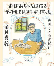
請求記号 388.8 カナ

おばあちゃんが猫を布巾に？ この衝撃的なタイトルは、「意外なところに道はある。解決策は一つではない。」という意味のフィンランドのことわざです。聞きなじみのない海外の36点のことわざが集められた本書では、その意味だけではなく背景にある歴史や文化について知ることができます。その国の言語で書かれた文字やカラフルなイラストにもお国柄が表れており、ことわざを通して世界を旅することができる本となっています。