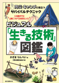
せいきゅうまごう 請求記号 78 カ

地震や台風、豪雨などの災害は、いつやってくるかわかりま せん。この本は、身近なものを活用してできるサバイバルテ クニックを、イラストと共に紹介しています。読むだけでな く、家やキャンプで実際に試しておくとし、いざという時にあ わてず行動できそうです。