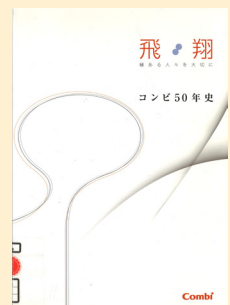
請求記号 K 589

ベビー用品でおなじみのコンビ。高度成長期の日本の住宅事情に合わせた、安全で快適なベビー椅子「コンビラック」で急成長を遂げました。そんなコンビ50年の歴史をたどるとともに、ベビー用品開発の移り変わりを見ることができます。「赤ちゃんを育てることが、楽しく幸せだと思える社会をつくる」をブランドビジョンに掲げるコンビ。時代の流れをよみ、トレンドをうみだすヒントを知ることができる一冊です。