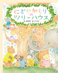
せいきゅうまごう 請求記号 PN ア

ねずみくんは、森に住む動物たちが集まれる、大きなお家が あったら楽しいだろうと思い、みんなに提案します。木を切 るのが得意なビーバーくん、運ぶのが上手なぞうさん。それ ぞれ得意なことをいかしてツリーハウスは完成に近づきます が、自分は役に立てていないと落ち込むねずみくんに、みん なは…。優しさあふれる、心温まるお話です。