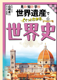
せいきゅうまごう 請求記号 209

世界史授業の動画配信で人気のYouTuber・ムンディ先生に よる本書。世界遺産を軸に、世界史が年代順に解説されてい ます。ページをめくる度に繰り広げられる、世界遺産にまつ わる色鮮やかな写真の数々は、世界史に詳しい人でも思わず 見入ってしまう1冊です。