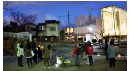
前回開催時の様子