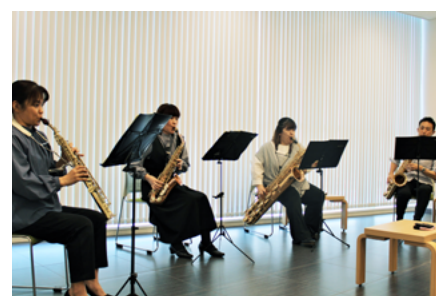
前回ご出演の様子