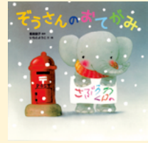
請求記号 PN イ

ある冬の日、郵便屋さんが手紙を届けに動物園にやってきました。動物達は、一体だれに手紙が来たのだらうと興味津々。手紙をもらったのはこどものぞうさんでした。手紙をくれたさぶろうくんに、大喜びでお返事を書くことにしたのですが…。心がほかほかとあたたかくなるようなお話です。