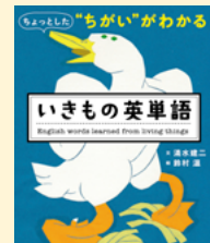
請求記号 834 シミ

英語のRatとMouseの違いを知っていますか？ 同じ生物でも大きさや雌雄、品種などで英単語を使い分けるそうです。この本には生物の英単語の使い分けがユニークなイラストと共に50種類以上収録されています。ぜひ手に取って好きなページから読んでみてください。