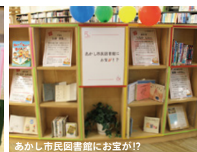
あかし市民図書館にお宝が!?