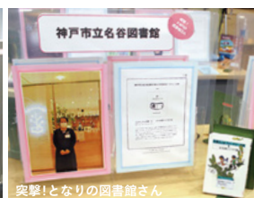
突撃!となりの図書館さん