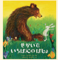
せいきゆうきごう 請求記号 PG ホ

「ぼくらのほらっぱはせかいでいちばんのぼしよかな？」ある日のうさぎは、まわりのともだちにたずねました。ともだちは「もちろん」とこたえますが、どうしても き 気になるのうさぎは、“せかいでいちばんのぼしよ”をさがすたびにでます。のうさぎが見つけたこたえとは、どこだったのでしょうか？