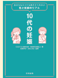
せいきゆうきごう 請求記号 367.9 ニシ

10代の子どものたちの性に対する多くの疑問や悩みに性教育講師の著者がわかりやすく答えてくれます。学校では教えてくれない…。家族や友達には聞きづらい…。それでも大切な性の知識について、学んでみませんか。