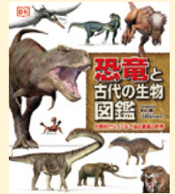
せいきゆうきごう 請求記号 45

恐竜は、私たち人間が誕生するよりはるか昔、地球に生きていた不思議な生物です。この本は恐竜のいろいろな謎が、迫力あるリアルなイラストで分かりやすく解説されています。恐竜よりも昔に生きた生物も載っていて、古代の生物に興味のある方にもおすすめです！