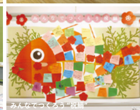
みんなで作ろう“祝鯛”