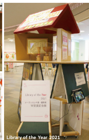
Library of the Year 2021