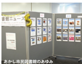
あかし市民図書館のあゆみ

図書館入口横では Library of the year 2021 優秀賞・オーディエンス賞W受賞を記念した展示も行いました。木製のトロフィーや賞状もお披露目しました!