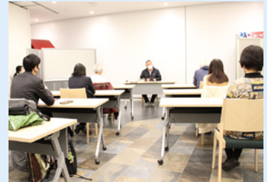
前回の地域学講座の様子