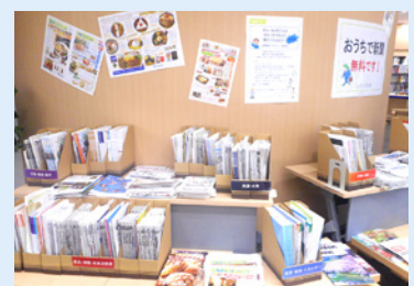
以前の展示の様子