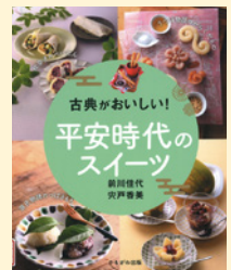
せいきゆうきごう 請求記号 38 マ

平安時代の貴族はどんなお菓子を食べていたのでしょうか。「枕草子」や「源氏物語」といった古典作品の中にも、実はお菓子が登場します。それらの作品の時代背景とともに、現代の材料で再現したアレンジレシピが紹介されています。平安スイーツで気分は平安貴族です。