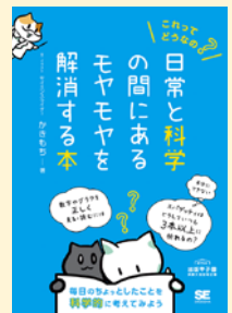
せいきゆうきごう 請求記号 404 カキ

何気ない日常生活の中にある科学。普段は意識してなくても、科学は意外と身近にあるものです。この本では日常に隠れている科学を“食と科学”、“健康と科学”などのテーマに分けて解説しています。「感覚ではわかるんだけど、説明しろと言われると…」そんなモヤモヤを解消できるかもしれません。