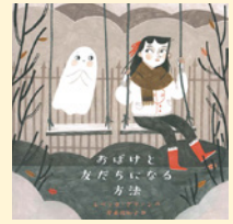
せいきゆうきごう 請求記号 PG ク

もし、あなたがおばけに出会ったらどうしますか？ 逃げ出しますか？ それとも、友だちになりますか？ もし、おばけとなかよくなりたと思う人がいたら、読んでみてください。おばけとなかよくなる方法や、おばけにとってキケンなこと、おばけのお世話のしかたもわかるかも。