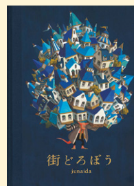
せいきゆうきごう 請求記号 PN シ

主人公の巨人は山の上にひとりぼっちでくらしていました。話 相手が欲しくて、ある夜、ふもとの街の家を一軒、住んでいる ひとごと持ち帰ってしまいました。それから毎晩、街の家やお店 を次々持っていきます。孤独だった巨人に友達はできるので しょうか。