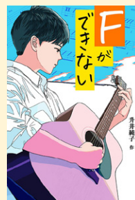
せいきゆうきごう 請求記号 91 マ

中学生になって自分を変えたいと思っていた直大は兄からギ ターをもらいました。ギターコードを覚えて少しずつ弾けるよ うになりますが、「壁」と言われる程難しいFのコードがどう してもできません。それでもクラスメイトとバンドを組み文化 祭に出ることに。できない事に挑戦することで自分の壁は超え られる。あきらめない勇気をもらえる一冊です。