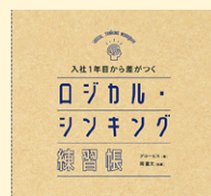
MBAで一冊的に 叩き込まれるビジネス教養 超実践ドリルで すぐに使えて 一生役立つ20の技術