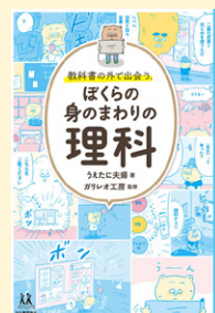
せいきゆうきごう 請求記号 40 ウ

かさぶたって、なんでできるの？ イオン飲料のイオンっ て？ 日常にあふれるさまざまな疑問を、中学生のポコ太が 謎の葉っぱのチカラで解決していきます。イラストで分かり やすく解説しているので、身のまわりのなぜ？が解決するか もしれません。科学好きの方に特にオススメです。