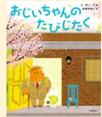
せいきゆうきごう 請求記号 PG ソ

ある日、おじいちゃんの家 いえ に、「おきやくさま」がやってきました。どうやら旅 たび のおともをしてくれるようです。おじいちゃんは大よろこびで旅 たび のしたくをはじめました。初めて行くところなので、心配 しんぱい もありますが、ひさしぶりに会える人たちがいることを楽しみにしているようです。おはなしもイラストも全部がやさしい絵本です。