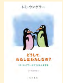
せいきゆうきごう 請求記号 159 ウン

どうして人には好きな色 いろ があるの？ 思春期 ししゅんき の子どもたちは、どうしてえらそうなの？ 答え こた に窮 きゆう しそうな子どもたちの質問 しつもん に、『すてきな三人ぐみ』の作者トミ・ウンゲラーが、物語 ものがたり を語るように柔らかい口調 くちよう で答えます。絵本作家ならではのユーモラスな回答で、どこか温かみのある人生の哲学書です。