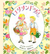
せいきゆうきごう 請求記号 94 へ

病気がちだった少年のもとに、ある日不思議な女の子があらわれました。美しい壁紙から出てきたその子と出会った後、少年は日に日に元気 げんき になっていきます。しかし、仲良くなったふたりにも別れの時 とき がやってきます。『ペレのあたらしいふく』を書いた、エルサ・ベスコフの隠れた名作です。