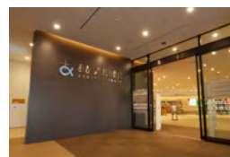
あかし市民図書館