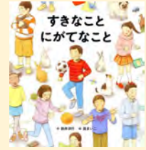
せいぎゆうきごう 請求記号 PN A

ぼくはスポーツがだいすきだけど、みんなの前で発表することはにがて。でも話すのがとくいなりんちゃんが助けてくれるから大丈夫。だれにでも「とくい」なことや「にがて」なことがあるけれど、そのままを受け入れる大切さを教えてくれる絵本です。