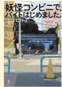
せいぎゆうきごう 請求記号 91 R

コンビニなのにすぐらい、人間には見えない妖怪コンビニ。少年イズミは、他の人には見えないものが見える、変わった能力を持っていて、そのコンビニで働くことになりました。ふしぎな商品や、ちょっと変わったお客さんに出会って変化していくイズミの日常を描いた物語です。