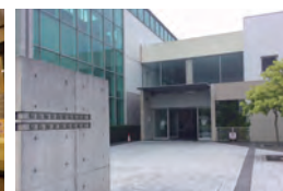
明石市立西部図書館