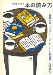
せいぎゆうきごう 請求記号 O19.5 オオ

中高生のみなさん、最近本を読みましたか？ 理科・古典・現代社会など学校の教科にあわせて、それぞれ「星と宇宙のストーリー」「古典を面白く読むには？」「近くて、知らない場所」などをテーマに、小説や論説文・解説書、漫画など様々なジャンルからのおすすめをピックアップ。どんな本を読んだらいいのか迷ったときは、まずこの本を読んでみてはいかがでしょうか？