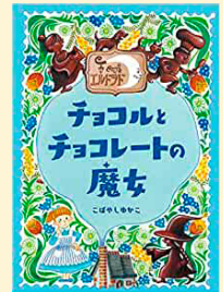
せいきゆうきごう 請求記号 91コ

カフェ・エルドラドはおかみさんと娘のチョコレート、お菓子職人のプルさんの3人でしている小さなお店。ある日、店に魔女の形をした甘いかおりのチョコレートがとどきました。ケーキに使おうと、おなべでとかすのですが…。バレンタインデーにあわせて、ちょっとふしぎなチョコレートのお話はいかがですか？