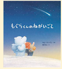
せいきゆうきごう 請求記号 PGキ

もぐらくんは大きな雪玉を作り、雪玉と家に帰ろうとバスを待ちます。しかし雪玉は乗せられないと運転手に言われ、雪玉をクマの形にすることで、なんとかバスに乗せることができました。バスの中は暖かく、眠ってしまいます。目がさめると雪玉のクマがいなくなっていました。どこに行っちゃったの!?