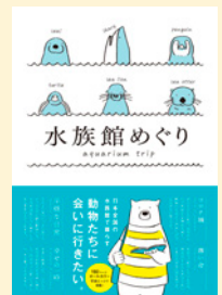
せいきゆうきごう 請求記号 480.7

全国40施設の水族館にいる生き物たちを“おなまえ”付きで生き生きとした写真とともに紹介しています。読んでいると「生き物たちに会いに行きたい!」と思えてくる1冊です。本の中の可愛い生き物たちに癒されてください。