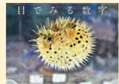
せいきゆうきごう 請求記号 410.4 オカ

身近にあふれている数字、それを目で見える形で表すと…？ 数に関する素朴な疑問や不思議、35項目を写真でわかりやすく解説しています。数字がちょっと苦手でも、思わず好奇心をくすぐられて、ページをめくってみたくなる本です。