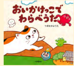
せいきゆうきごう 請求記号 PN ツ

かわいいねことたこが、わらべうたに合わせて追いかけてきます。コミカルなイラストを楽しみながら、最近では触れる機会が少なくなったわらべうたを、親子で一緒に歌いたくなる絵本です。