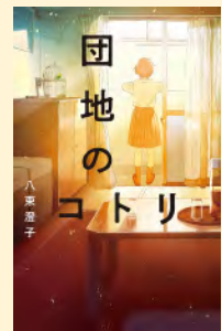
せいきゆうきごう 請求記号 91 ヤ

中学3年の美月はバレーボールに夢中で毎日が充実していた。ある日、同じ団地に独りで住むおじいさんの家に、知らない女の子と母親がこっそり住んでいることに気づく。この人たちが同じ家に暮らす理由とは…。社会が優しい気持ちで満ちていることを願いたくなるお話です。