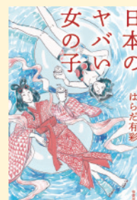
請求記号 910.2 ハラ

イザナミノミコト、乙姫、かぐや姫、虫愛ずる姫、皿屋敷のお菊etc... 日本の昔話や神話に登場する女性たち。時には才女、時には悪女として描かれる「ヤバい」女の子たちに、「どうしてそんなことしちゃったの?」と現代女性の目線から語りかける新感覚のイラストエッセイ。彼女たちが物語の役割に縛られているように、私たちも現代社会の役割に縛られているのかもしれない。物語に登場する彼女たちを役割から解放して、私たちもまた解放されましょう。古典の見方と、明日からの生き方が変わるかもしれない1冊です。