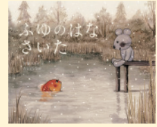
せいきゆうきごう 請求記号 PN A

あるさむい冬の日、こねずみが池のほとりでなっていると、「なくのはやめてよ」と金魚が顔を出しました。「ひとりぼっちだ」となきつづけるこねずみに、金魚はちがうと言いきかせます。そんなふたりの間には、いつのまにか友情が。さむい冬のおはなしですが、あたたかい気持ちになれる絵本です。