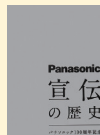
請求記号 K 540

2018年に創業100周年を迎えたパナソニックには、歴代の宣伝部長が代々引き継いできた7つの「宣伝の基本的な考え方」があります。その1つは、宣伝は企業の社会的使命であるということ。創業者の松下幸之助氏は、良い商品の人々に知らせ、その暮らしをより良いものにするために、宣伝・広告を重要視しました。この考えが現在も受け継がれているのです。広告は時代を映す鏡です。パナソニック100年の宣伝・広告をビジュアル的に網羅したこの本は、時代を鮮やかに蘇らせてくれます。