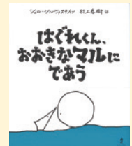
せいきゆうきごう 請求記号 726.6 シル

はぐれくんには、かどがあります。だから一緒に転がって、どこかに連れて行ってくれる誰かを待っています。ある日、おおきなマルがやってきて言いました。「きみはたぶんじぶみだけでころがれるよ」。自分を変えるにはどうすればいいのか？『ぼくを探しに』の続編を村上春樹が新訳した本です。