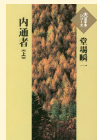
請求記号 080 トウ

汚職事件を追う刑事の元に愛娘から助けを求める連絡が。親子の関係が事件の深い場所へとつながっていく硬派な警察小説が、「大活字本」になりました。「大活字本」は通常の文字サイズでは読むことが難しい方のために、大きい文字、広い行間で印刷されています。文字が大きいと、分冊になっているものも多く、この小説も3分冊されています。最近、少し字が読みにくくなったなあと感じられる方、ユニバーサルコーナーを覗いてみてください。